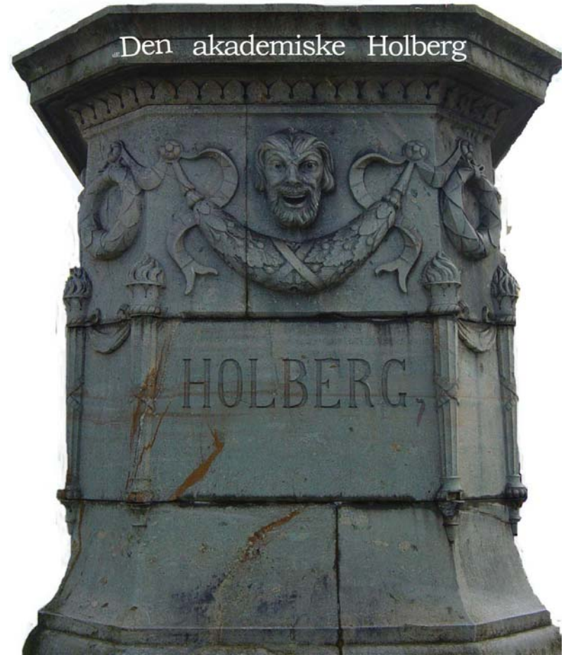
Den akademiske Holberg